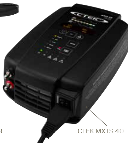
CTEK MXTS 40