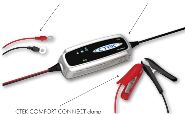
CTEK COMFORT CONNECT clamp